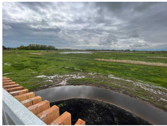
Foto: het uitzicht vanaf de uitkijktoren