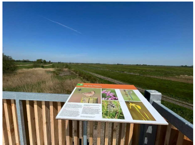
Foto: uitzicht vanaf de uitkijktoren