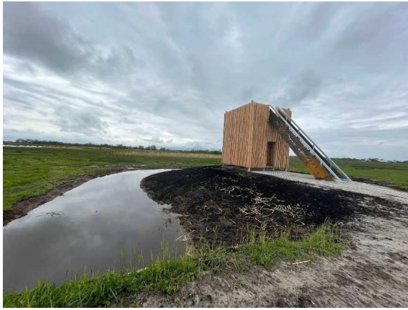
Foto: De uitkijktoren in Polder de Dijken-Bakkerom